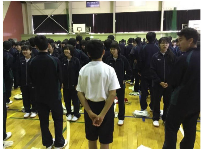
隣の人と向かい合って 校歌の歌詞を確認しました(校歌の練習)