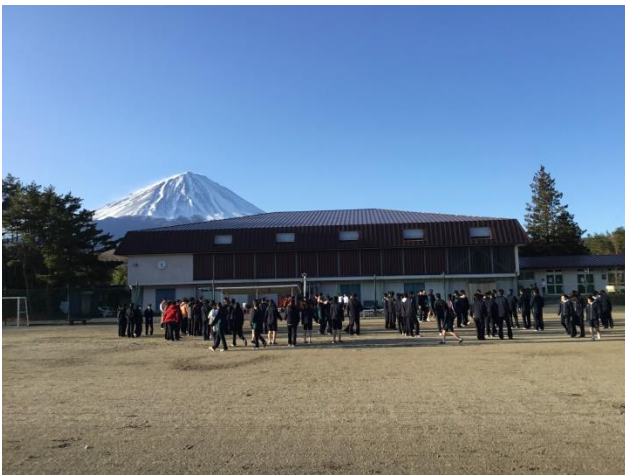
朝礼では富士山に向かって整列をしました