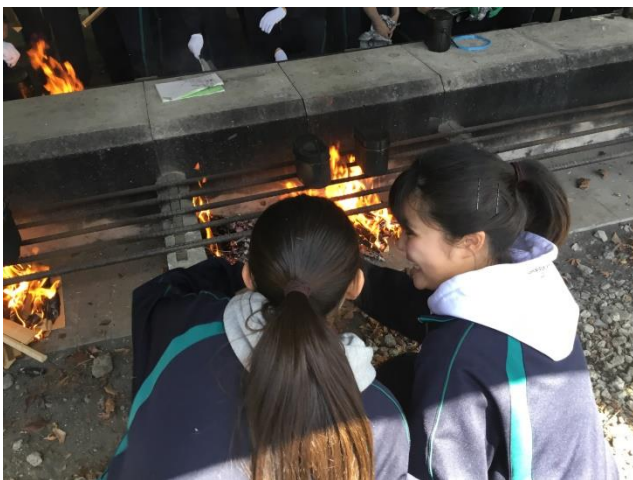
初めての火起こしは大変でした