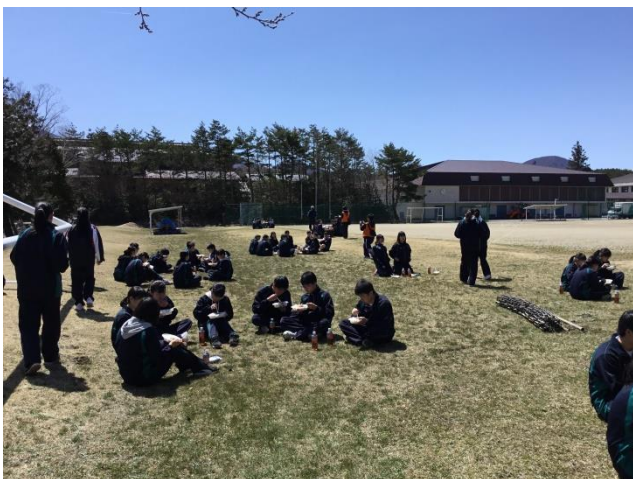
グループメンバーで仲良くカレーを食べました