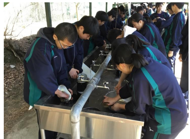
食べた後はしっかり洗い物もしました