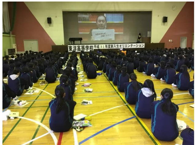
正路進路主任による激励ビデオレター