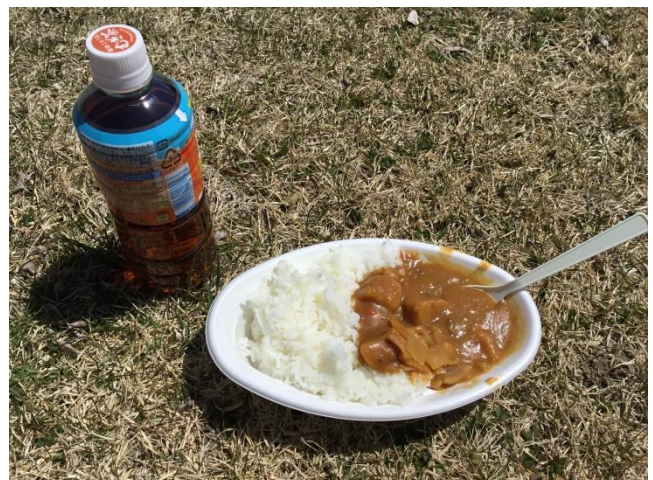
美味しく出来上がりました